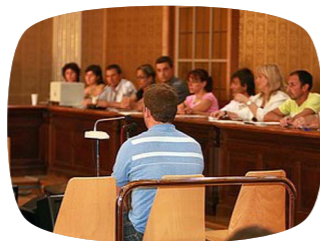
Un mossos, xxx, que va ser absolt, durant el judici a l'Audiència de Girona.

Al final va ser absolt del tot, però Boujaama xxx va haver de ser jutjat tres vegades per homicidi, perquè el primer cop el van considerar autor del crim, però també que havia actuat en legítima defensa. En la primera consideració el jurat el feia culpable i en la segona no. El Tribunal Superior de Justícia de Catalunya va ordenar la repetició del judici. Quan el van repetir, l'acusat va resultar absolt, però el veredictes no estava prou motivat i el TSJC va ordenar que es tornés a repetir. Al final es van fer les coses bé i es va acabar el tràngol per a xxx.