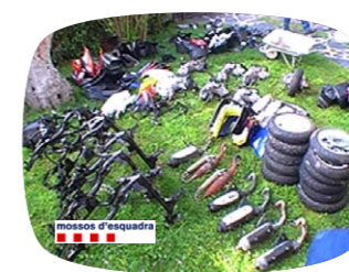
Material confiscat pels Mossos d'Esquadra.

Per perpetrar els robatoris, els membres de la banda ara desarticulada actuaven de nit i en grups de quatre o cinc persones. Els vehicles sostrets eren desmuntats i enviats al nord d'Àfrica, on es revenien al mercat negre a uns 1.000 o 1.500 euros, molt per sota dels preus del mercat.